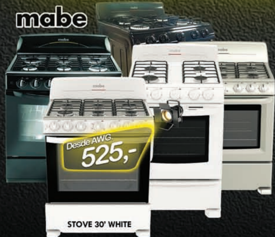
STOVE 30' WHITE EMI7620BAPB1